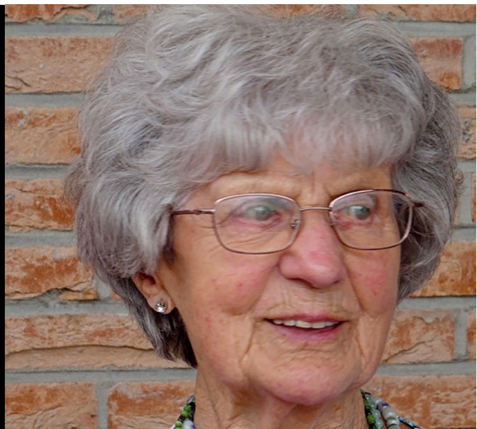
Geen gegevens van koppeling

'Korrie was mijn tweede moedertje, ze waste ons in de teil'